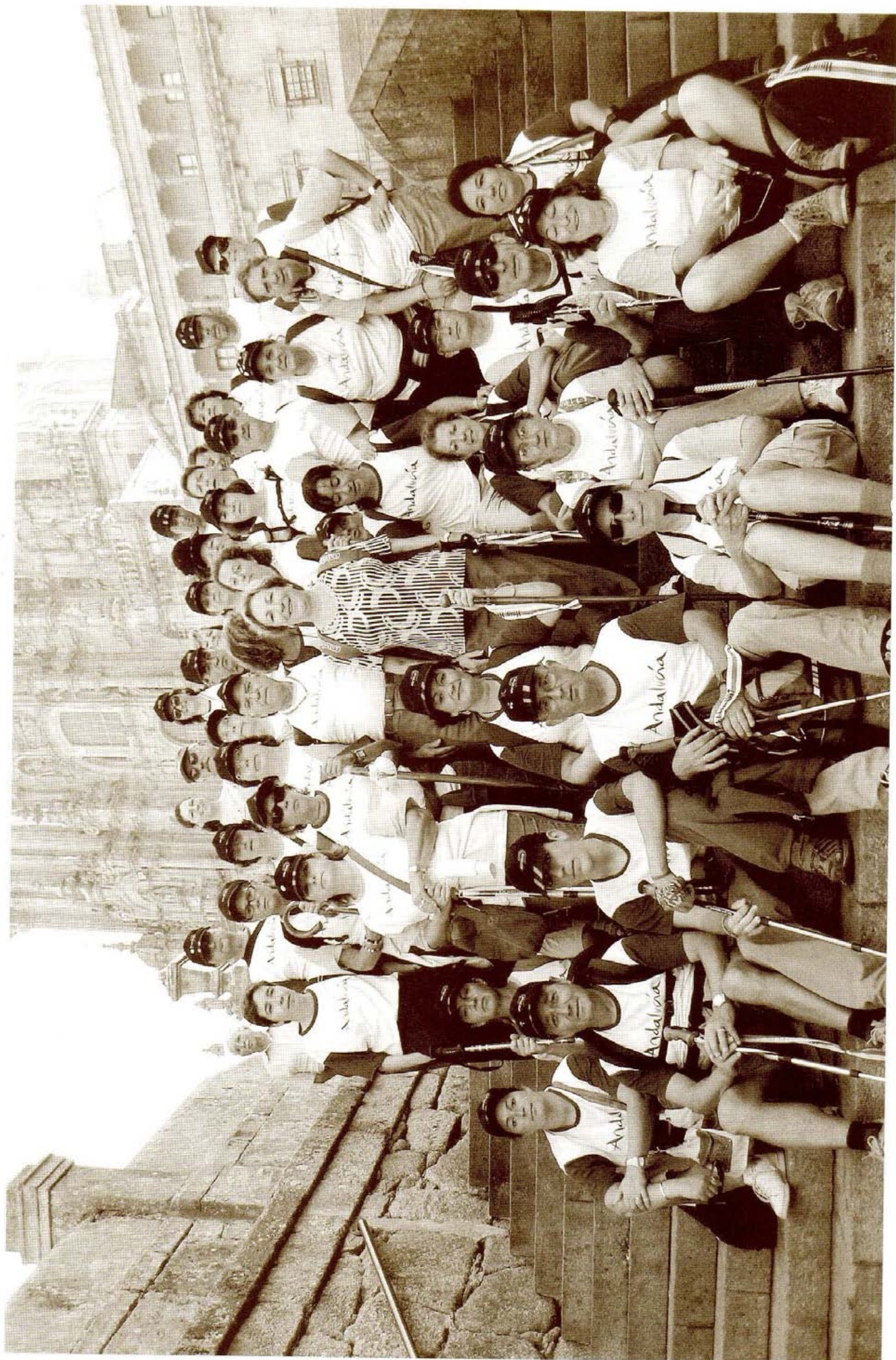
Los peregrinos de la Hermandad ante la Catedral de Santiago, el 9 de Septiembre de 2007