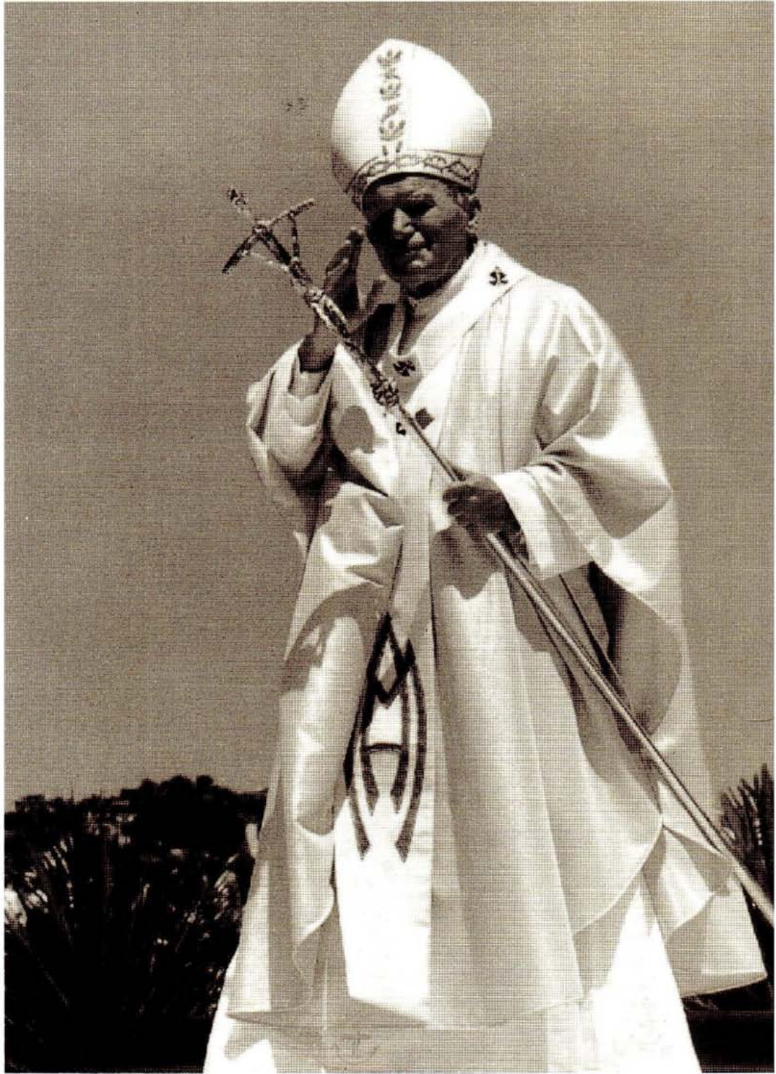
Joannes Paulus II