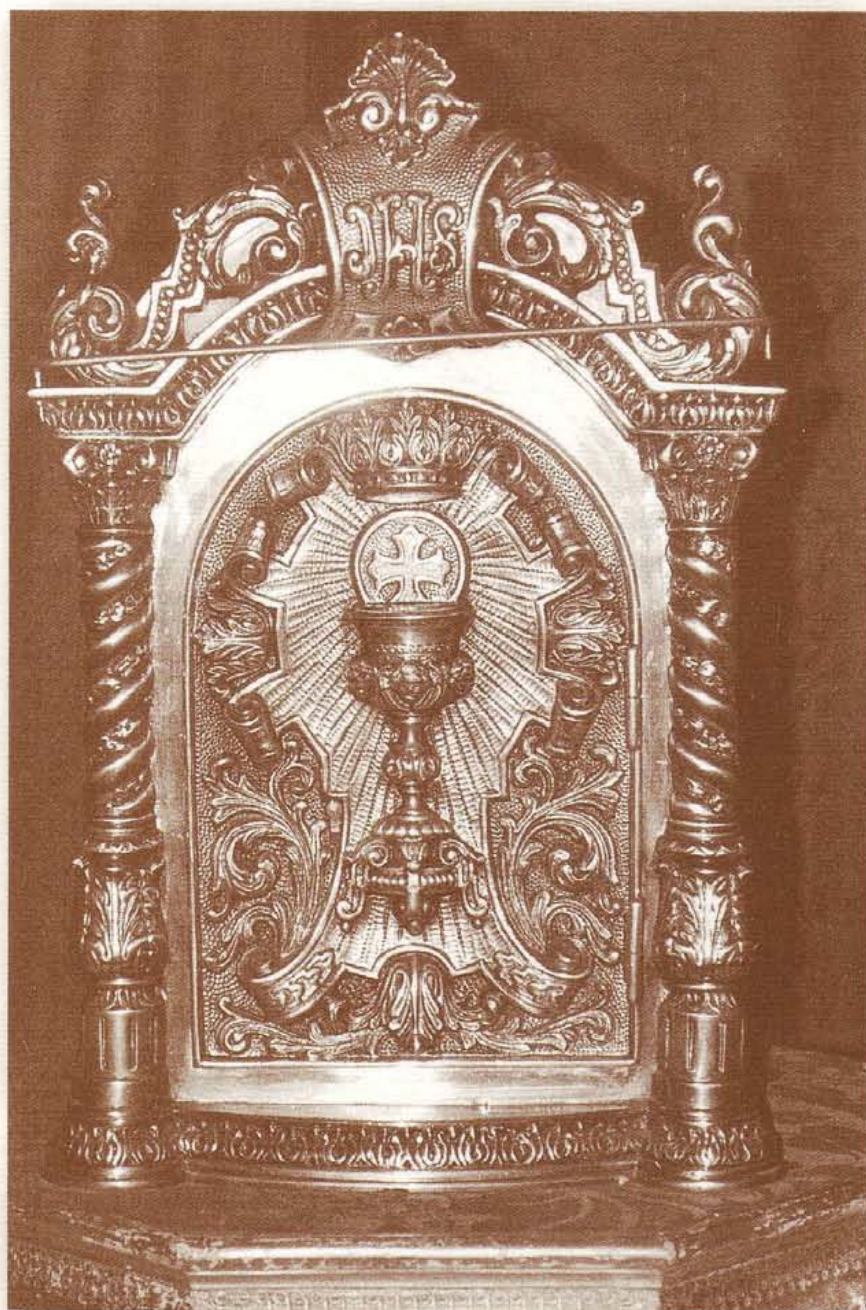
Buscad la Misericordia en el Sagrario