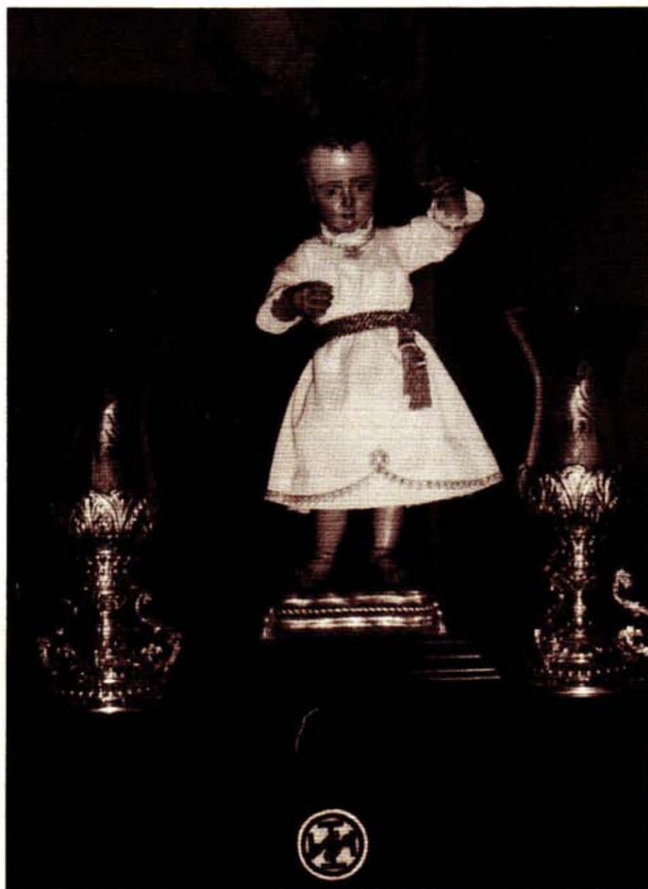
Niño Jesús de la Misericordia